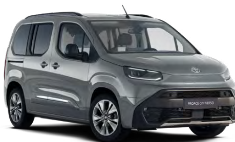
KCA Stříbrná atomická metalický lak 15000 Kč