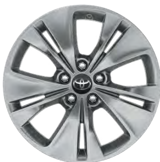
17" litá kola (5 zdvojených paprsků) Pro výbavu Family a VIP