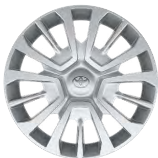
16" ocelové disky kol s ozdobnými kryty (5 trojitých paprsků) Pro výbavu Business