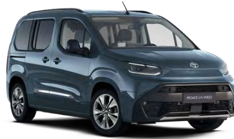
KJW Světlá modrá metalický lak 15000 Kč