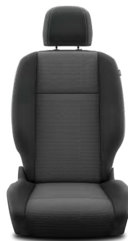
Látkové čalounění sedadel Manhattan Pro výbavu Business, Family a VIP