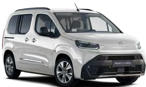
EPR Bílá ledová standardní lak bez příplatku