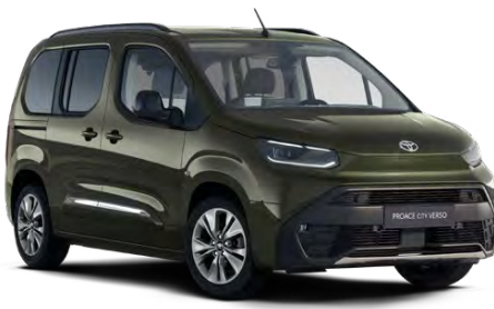
KNQ Zelená khaki metalický lak 15000 Kč