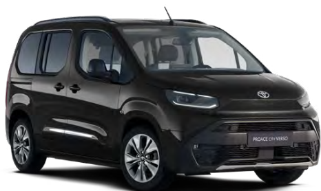
KTV Černá vesmírná metalický lak 15000 Kč