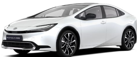
089 Bílá perleťová Perleťový lak 22 500 Kč