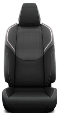
Látkové čalounění (FA20) Pro verzi Comfort a Prestige