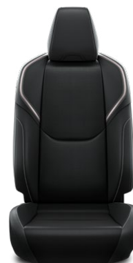
Černé čalounění z veganské kůže (EA20) Pro verzi Executive