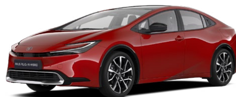
3U5 Červená karmínová Speciální lak 22 500 Kč