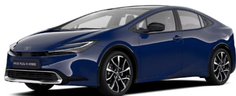
8Q4 Modrá námořní Základní lak bez příplatku