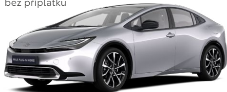
110 Stříbrná třpytivá Metalický lak 15 000 Kč