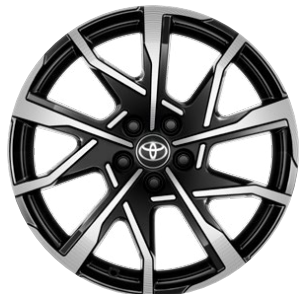
19" kola z lehké slitiny, pneumatiky 195/50 R19 Pro verzi Prestige a Executive