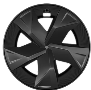
17" kola z lehké slitiny, pneumatiky 195/60 R17 s celoplošnými kryty Pro verzi Comfort