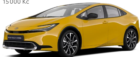
5C5 Žlutá hořčicová Metalický lak 15 000 Kč