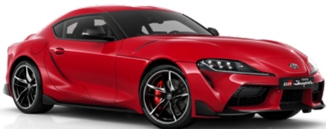
D05 – Červená Prominence standardní lak, bez příplatku