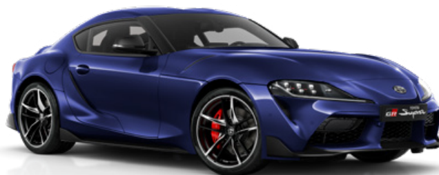
D13 – Modrá metalický lak, 22 500 Kč