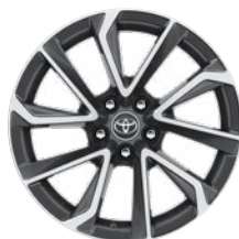
18" kola z lehké slitiny, pneumatiky 225/40 R18 Pro výbavu Executive