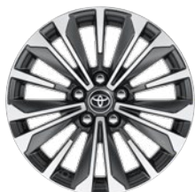
17" kola z lehké slitiny, pneumatiky 225/45 R17 Pro výbavu Style