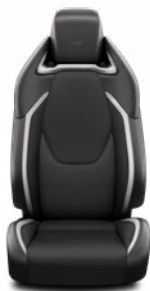
FC21 Syntetická kůže černo-šedé Pro výbavu GR SPORT