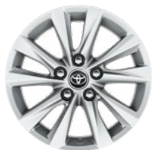
16" kola z lehké slitiny, pneumatiky 205/55 R16 Pro výbavu Comfort