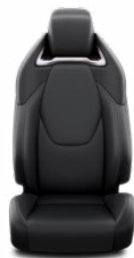
LC20 Syntetická kůže černé Pro výbavu Executive