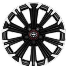
17" kola z lehké slitiny, pneumatiky 225/45 R17 Pro výbavu GR SPORT