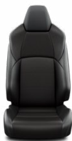
EA21 Textilní v kombinaci se syntetickou kůží černé Pro výbavu Style