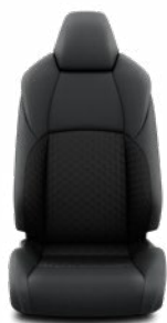
FB21 Textilní černé Pro výbavu Comfort