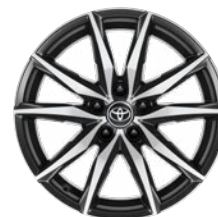
18" kola z lehké slitiny, pneumatiky 225/40 R18 Pro paket Dynamic